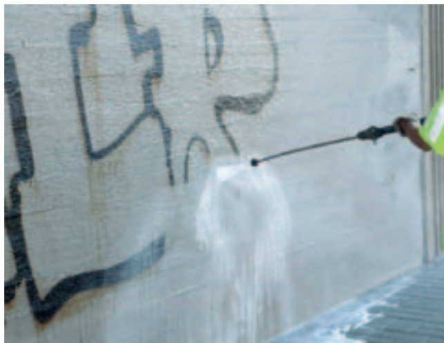
Kuva 6. Töherrysten poistoa pesemällä.

Siltojen purettavat puuosat ovat yleensä huonossa kunnossa, joten niiden uudelleenkäyttö on rajoittavaa. Pysyvästi siltaan tarkoitettu puumateriaali on lisäksi usein kyllästettyä, jolloin hyötykäyttöä rajoittavat ongelmajättemääräykset. Muotti- ja telinemateriaaleja sen sijaan voidaan käyttää useinkin kertoja.