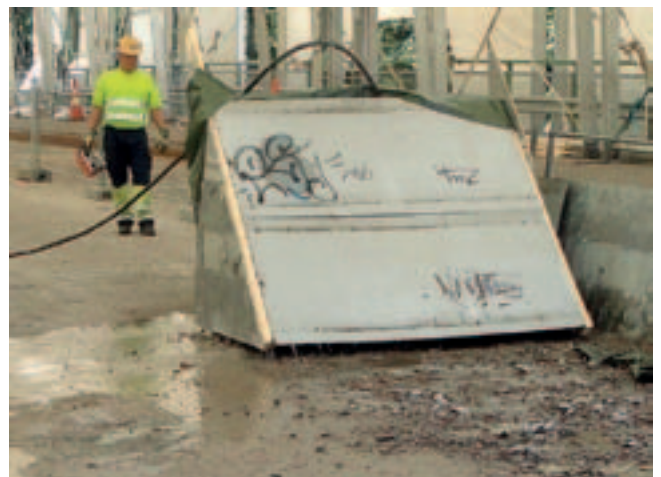
Kuva 5. Sillan kannen vesipiikkausta.