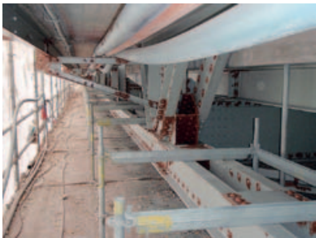
Kuva 8. Maalin leviäminen estetty asianmukaisilla suojuksilla.

Maalin tippuminen tai roiskuminen ja maalisumun leviäminen ympäristöön on estettävä (kuva 8). Maalausmenetelmä vaikuttaa siihen, mitä suojaustoimenpiteitä joudutaan tekemään. Sivellin- ja telamaalauksessa on estettävä maalin tippuminen ja roiskuminen, ruiskutuksessa myös maalisumun leviäminen. Suurpaineruiskussa on oltava pikasulkijaventtiili. Letkut on pidettävä hyväkuntoisina ja ne on tarkastettava maksimipaineella.