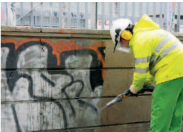
Kuva 7. Soodapuhallusta.

Suihkupuhdistuksessa käytetään avopuhallus-, tyhjiöpuhallus-, vesisuihku- (märkäpuhallus) tai sinkkopuhdistuslaitetta. Menetelmästä riippuen suihkupuhdistustyössä syntyy melua sekä pölyä ja jätettä puhallusmateriaalista, irtoavasta pintakäsittelyaineesta, ruosteesta ja betonista. Kokemusten mukaan pöly ei leiju ilmassa laajalle alueelle, mutta haittaa liikennettä, etenkin jos puhallussuihku on ajoradalle tai kevyenliikenteen väylään päin. Tuulen suunta ja voima vaikuttavat oleellisesti epäpuhtauksien leviämiseen. Pölystä muodostuu lautoja, jotka kulkeutuvat aallokon tai virran mukana. Suihkupuhdistus voidaan tehdä myös suurpainevesipuhalluksella, jolloin vesi siivilöidään jätteestä erikseen. Suihkupuhdistuskohde on suojattava pölyn leviämisen estämiseksi. Myös soodapuhallusta voidaan käyttää tapauskohtaisesti suihkupuhdistuksen tavoin (kuva 7). Soodapuhalluksessa käytettävä sooda ei ole ongelmajäte, joten purkujätteen luokitus määräytyy purettavan materiaalin perusteella.