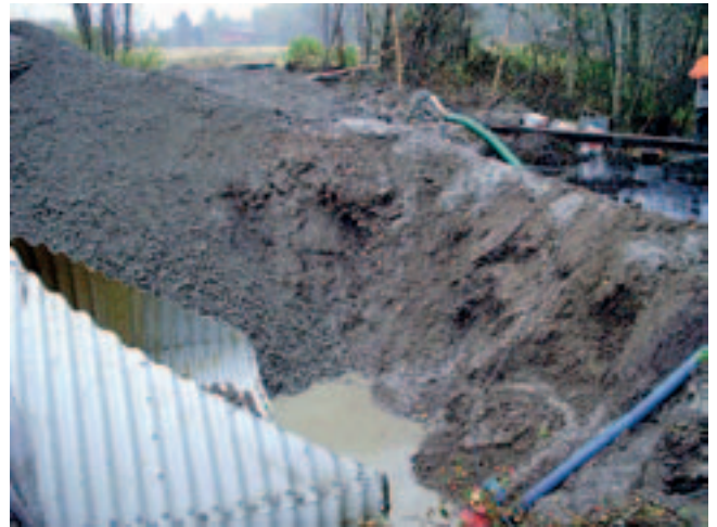
Kuva 12. Väliaikainen maapato putkisiltatyömaan yhteydessä.

Ympäristön kannalta paras vaihtoehto on käyttää kaikki käyttökelpoiset massat uudelleen, lajitella läjitettävät massat ja käyttää rakenteisiin kelpaamaton materiaali mahdollisimman lähellä syntyipaikkaa, esim. pengerryksiin, maisemointiin, meluvalleihin ja viherrakentamiseen. /13/