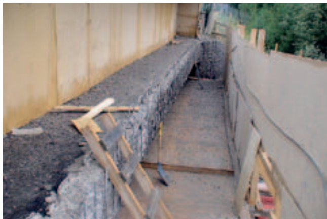
Kuva 1. Suojarakenteet reunapalkin purkutyötä varten.