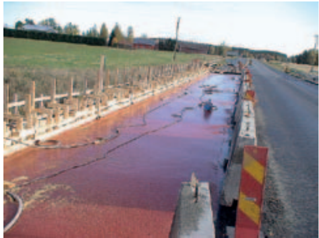
Kuva 11. Epoksiivistystä käytettäessä haitallisten aineiden pääsy ympäristöön on yleensä helposti estettävissä.

Päällystystöissä on noudatettava huolellisuutta käsiteltäessä öljyjä, bitumiliuoksia, metyleenikloridia tai muita haitallisia aineita. Jyrsittävien asfalttimassojen uusiokäyttöön pitää varautua varastoimalla massat esimerkiksi asfalttiasemalle. Asfalttijätteen varastoinnille tulee olla paikallisen ELY-keskuksen lupa.