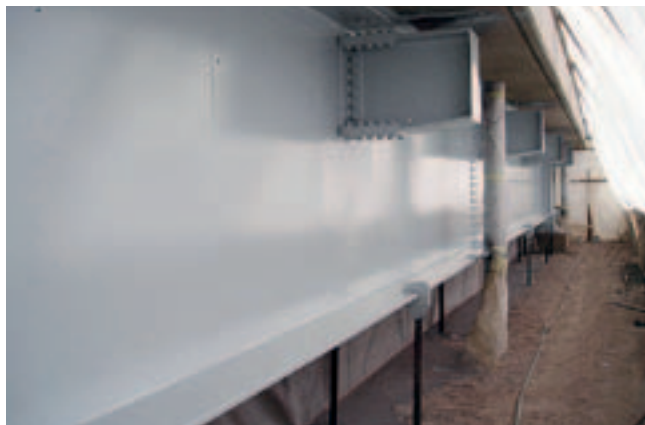
Kuva 3. Teräspalkin pintakäsittelyä varten tehty suojaus suuressa vesistösillassa.