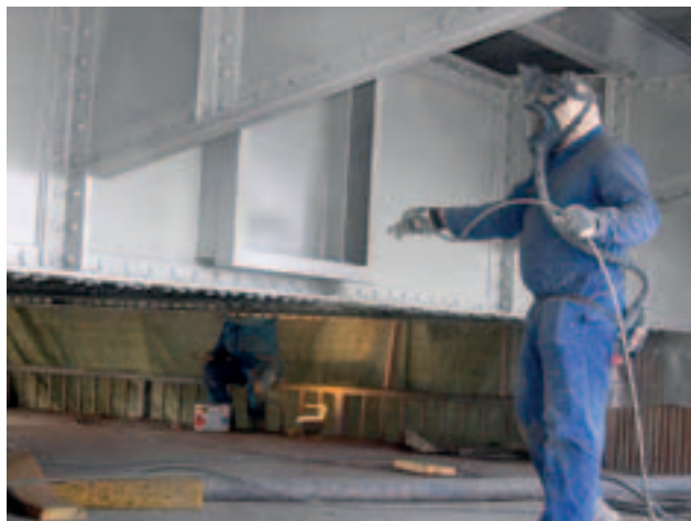
Kuva 9. Ruiskumaalauksessa.

Maalien käyttöturvallisuustiedotteissa on maininta maalien ympäristöhaitoista. Maalia ei saa päästää viemäriin, maaperään eikä vesistöön. Käyttöturvallisuustiedotteessa annetaan myös erityisiä ohjeita tuotteiden varastoinnista, korroosio-ominaisuuksista, puhdistuksesta, siivouksesta ja vaarattomaksi tekemisestä; ohjeita annetaan myös tulipalon varalta.