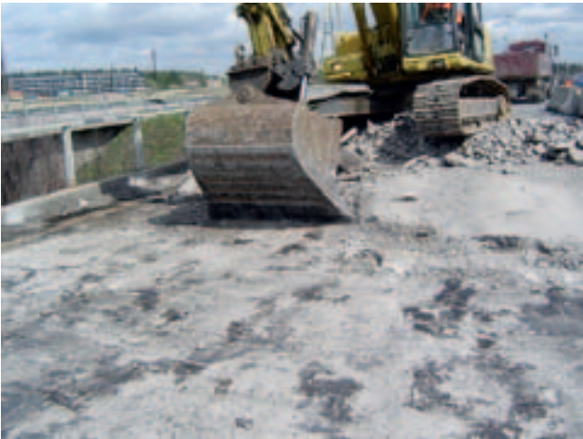
Kuva 10. Päällysteen poistoa kaivinkoneella.

Betonin pintaan kiinni jäänyt eriste käsitellään betonin poiston yhteydessä. VNa 591/2006 mukaisesti hyödynnettäessä esimerkiksi betonijätettä maarakentamisessa on huolehdittava, että jätteen haitallisten aineiden pitoisuus ja liukoisuus eivät ylitä mainitun asetuksen liitteessä 1 säädettyjä raja-arvoja, eikä jäte sisällä epäpuhtauksina muutaakaan haitallisia aineita siten, että sen hyödyntämisestä voi aiheutua vaaraa tai haittaa terveydelle tai ympäristölle /9/. Yleensä betonin hyötykäyttöön liittyvissä tutkimuksissa ei ole havaittu vesieristeistä aiheutuvia raja-arvon ylityksiä.