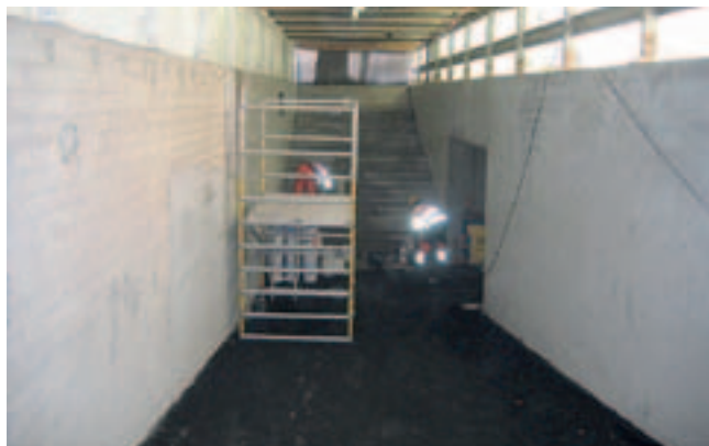
Kuva 2. Siisti ja hyvin suojattu työmaa.